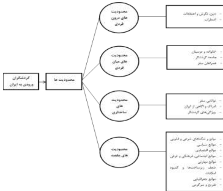
نمودار (۲): مدل مفهومی پژوهش