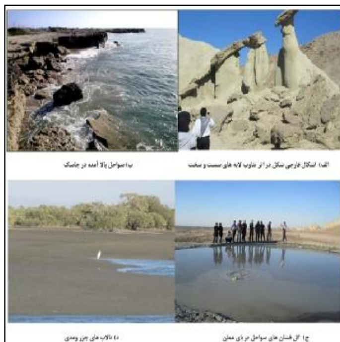
شکل (1): ژئومورفوسایت‌های مورد مطالعه در استان هرمزگان

در این بخش با استفاده از بررسی‌های میدانی و کتابخانه‌ها، مفاهیم اساسی و ویژگی‌های ژئومورفولوژیکی این چشم‌اندازها مورد بررسی اجمالی قرار گرفته است که در جدول 4 توضیحات اجمالی آن درج شده است.