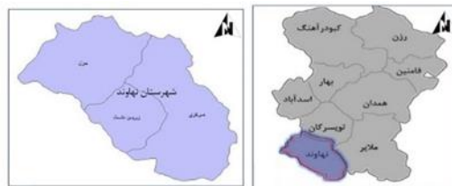
نقشه ۱- موقعیت جغرافیایی شهرستان نهاوند

شهرستان نهاوند با مساحتی در حدود ۱۵۳۵ کیلومترمربع در جنوب غربی استان همدان واقع شده است. این شهرستان از شمال به شهرستان