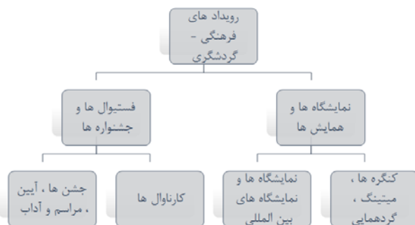
شکل ۲: مهم‌ترین رویدادهای فرهنگی - گردشگری