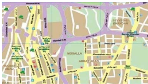
شکل ۳: موقعیت مصلی امام خمینی (ره) (محل برگزاری نمایشگاه کتاب تهران) در نقشه تهران

مصلی امام خمینی (ره) علی‌رغم دارا بودن پتانسیل‌های لازم یک‌سری چالش‌های اساسی دارد که مدیریت شهری می‌بایست با درایت بدان توجه نموده و سعی در ترفیع محدودیت‌ها کند. عدم استاندارد بودن مکان برگزاری به لحاظ چیدمان غرفه‌ها، حمل و نقل درون نمایشگاهی، سردرگمی بازدیدکنندگان برای دسترسی به غرفه دلخواه و همچنین مسأله ترافیک از هم این چالش‌هاست.