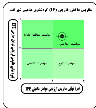
شکل ۲: ماتریس داخلی خارجی (IE) گردشگری مذهبی شهر تفت

با توجه به جدول ۲ می‌توان از مهمترین نقاط قوت در گردشگری مذهبی شهر تفت به مواردی همچون مجاورت و نزدیکی به مراکز جمعیتی و مراکز شهری مثل شهر یزد و اجرای مراسم عزاداری با سبکی متمایز از سایر نقاط استان یزد با امتیاز وزنی ۰/۸ به‌عنوان نخستین قوت، وجود چشم‌اندازهای زیبا و منحصر به‌فرد به‌همراه فضای سبز و باغات در شهر و وجود نذورات و قوفات بالا جهت پذیرایی از گردشگران با امتیاز ۰/۳ به‌عنوان دومین قوت، وجود فضای مناسب جهت پارکینگ خودرو با امتیاز ۰/۱۵ به‌عنوان سومین قوت، ظرفیت و فضای مناسب این شهر جهت جذب گردشگران و همچنین مستعد و آماده بودن منطقه جهت سرمایه‌گذاری و برنامه‌ریزی گردشگری و معرفی آن به‌عنوان قطب مهم گردشگری با امتیاز وزنی ۰/۱۴ به‌عنوان چهارمین قوت، عدم هم‌زمانی اجرای این مراسم در شهر تفت با مراکز شهری اطراف مثل شهر یزد با امتیاز ۰/۱۲ به‌عنوان پنجمین قوت شناخته می‌شوند. باتوجه به جدول ۲ می‌توان گفت کوتاه بودن مدت اقامت گردشگران در شهر وعدم بازده اقتصادی گردشگران برای شهر با امتیاز وزنی ۰/۶، ضعف زیرساخت‌های مرتبط با امر گردشگری در شهر با امتیاز ۰/۴۵، وجود ترافیک سنگین در ساعات آغازین و پایانی مراسم در شهر و جاده‌های خارج از شهر امتیاز ۰/۳، تحمیل بار مالی بر دوش ادارات و سازمان‌های شهر مثل شهرداری با امتیاز ۰/۲۵، آلودگی و ایجاد زباله و همچنین عدم اطلاع‌رسانی و معرفی کامل این مراسم در سطح کشور با امتیاز ۰/۱۵، اختلال گردشگران در اجرای مراسم با امتیاز وزنی ۰/۱ به‌ترتیب مهم‌ترین نقاط ضعف گردشگری مذهبی شهر تفت می‌باشند.