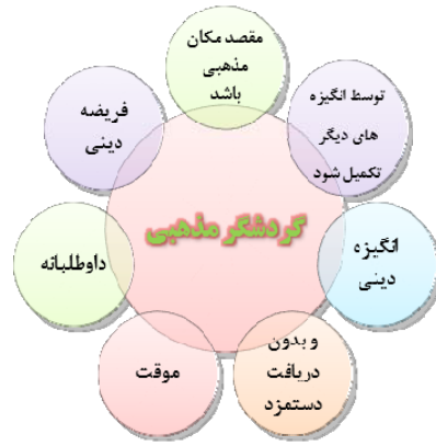
شکل ۱: ویژگی‌های گردشگر مذهبی