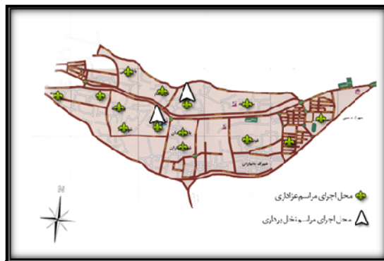
نقشه ۲: موقعیت اماکن اجرای مراسم عزاداری در شهر تفت