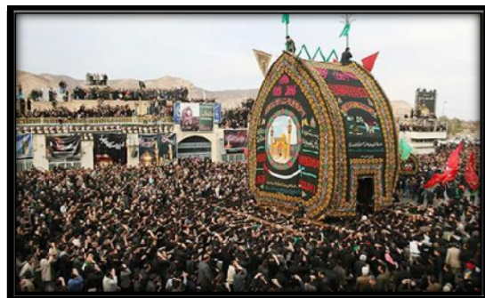
تصویر ۱: تصویری از مراسم نخل برداری روز عاشورا