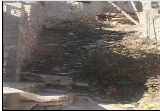
شکل ۷ نا امنی راه‌های دسترسی روستاگلابر ایچرود