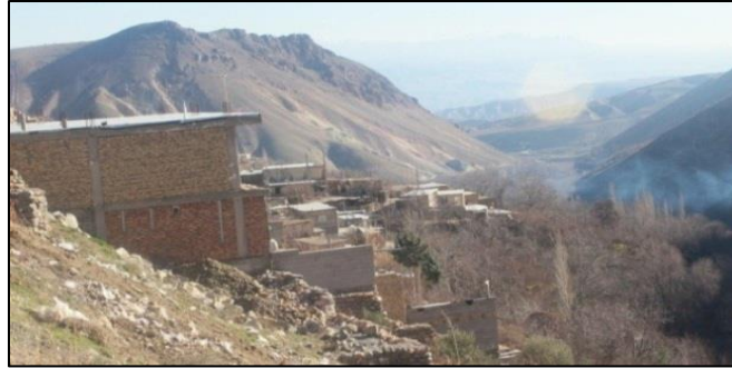
شکل ۲ شیب زیاد اراضی، روستای قانلی خدابنده