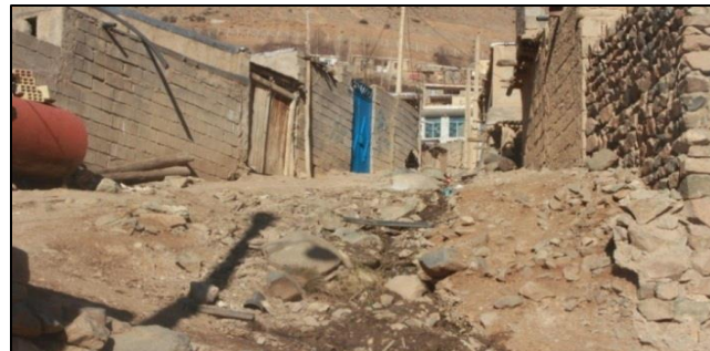
شکل ۵ وضعیت نامناسب کوچه، روستای شیت طارم، منبع: یافته های تحقیق (۱۳۹۸)