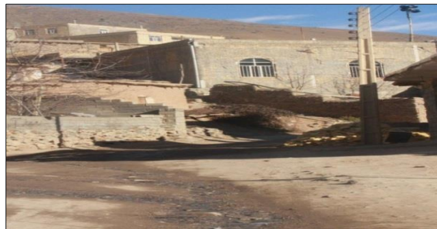
شکل ۴ رهاسازی فاضلاب خانگی، روستای گلابر ایجرود