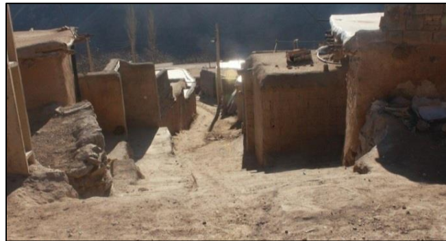
شکل ۳ وضعیت نامناسب معابر، روستای علم کندی ماهنشان، منبع: یافته های تحقیق (۱۳۹۸)