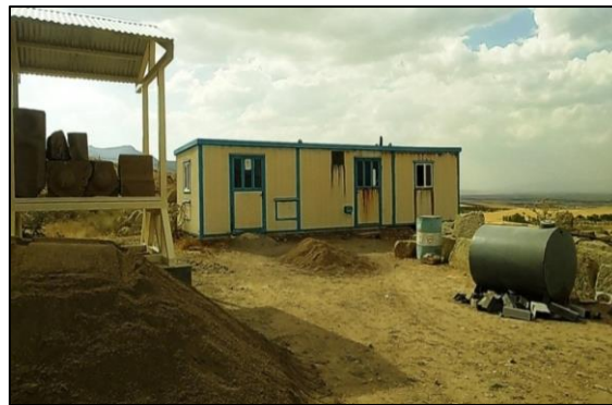
شکل ۸ عدم دسترسی به آب آشامیدنی لوله کشی شده، روستای ویر سلطانیه

استخراج گردید. در این مرحله مدل نهایی تحقیق طراحی شد. مدل مفهومی تحقیق نشان می‌دهد که شرایط علی (۱). تخریب بافت روستا ۲. مسائل محیطی ۳. چالش ضعف امکانات-خدمات ۴. ساختار حمل و نقل) سبب بروز پدیده مشکلات کالبدی در روستاهای هدف گردشگری شده است. شرایط زمینه‌ای (توپوگرافی، شیب زیاد) و شرایط مداخله‌ای (موانع مدیریتی، ساختاری) نیز بر پدیده محوری تحقیق تأثیر گذاشته است که منجر به بهره‌گیری از راهبردهای نامتجانس و ناموزون در ساختار کالبدی روستا گردیده است که این اجرای این راهبردها سبب بروز پیامدهای دوگانگی کالبدی-اجتماعی، محرومیت از مزایای توسعه از مزایای توسعه گردشگری شده است.