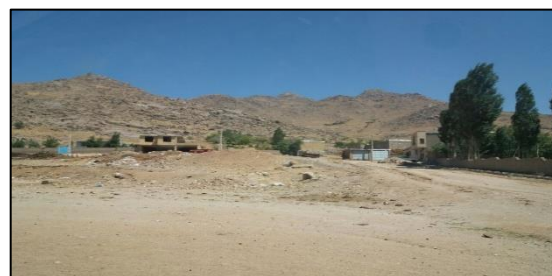
شکل ۶ تصویر پایین بودن کیفیت‌های ارتباطی بین روستایی، روستای سوکهریز خرمدره