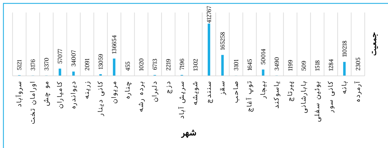
نمودار ۱ جمعیت شهرهای استان کردستان در سال ۱۳۹۵ نگارنده