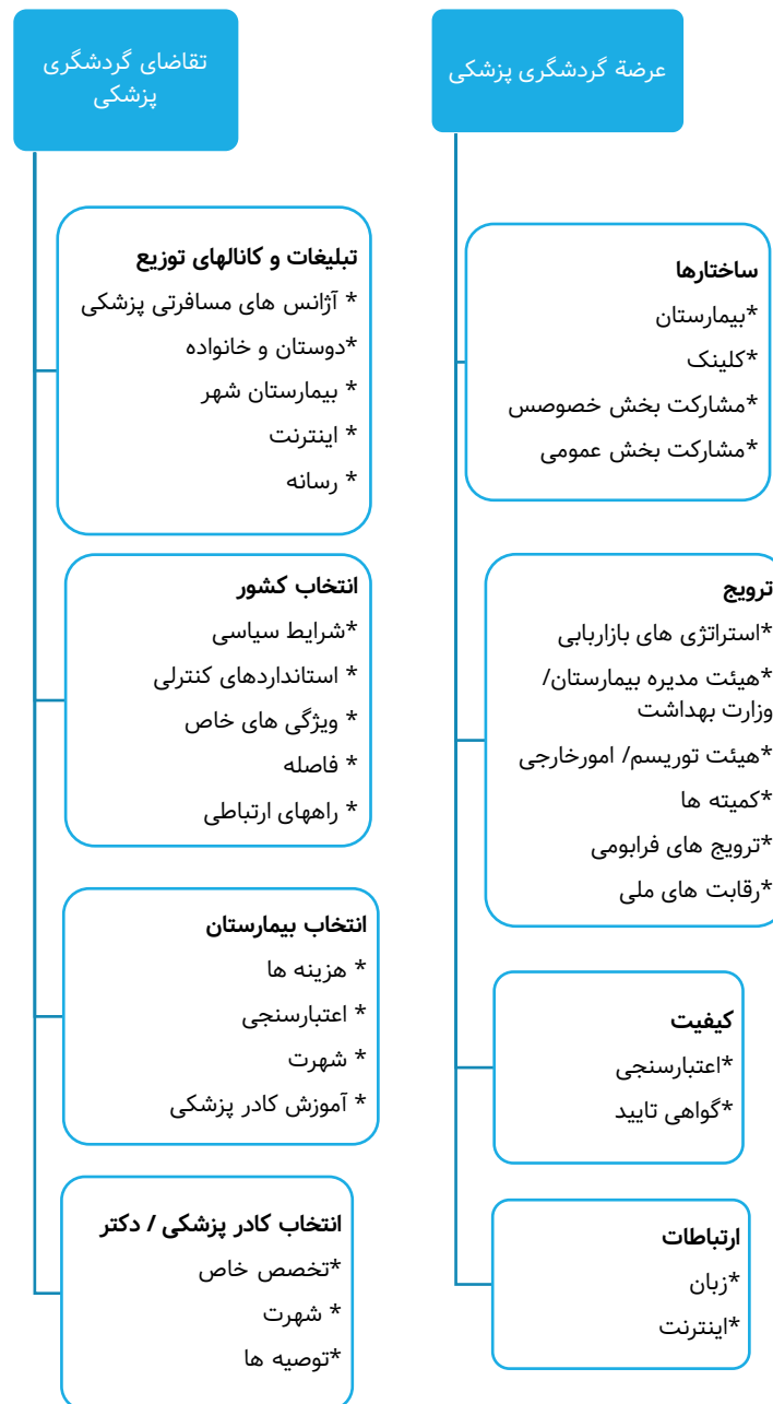
شکل شماره دو- مدل عرضه و تقاضای گردشگری پزشکی (هیونگ و همکاران، ۲۰۱۰)

در مرحله اول، به روش مرور نظام مند و با استفاده از کلید واژه‌های «گردشگری پزشکی، عوامل مؤثر و عوامل جذب» در پایگاه‌های scopus، IranDOc، science Direct عوامل مرتبط با جذب گردشگران استخراج و در مرحله دوم با استفاده از مدل تحلیل سلسله مراتب AHP (Analytic