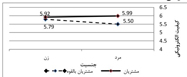
نمودار ۳: کیفیت الکترونیکی تابعی از متغیر جنسیت

در گروه مشتریان بالقوه زن‌ها به‌صورت معناداری کیفیت الکترونیکی بالاتری را در مقایسه با مردها ادراک داشته‌اند ( p\text{-value} = 0/000 )، در حالی که این تفاوت معنادار در گروه مشتریان فعلی با ضریب p\text{-value} برابر با 0/121 مشاهده نشد (نمودار ۳) لازم به‌ذکر است که از بین سه متغیر جمعیت‌شناختی فوق، نقش جنسیت بر الگوهای رفتاری در تجارت الکترونیکی همواره مورد تأکید محققان قرار دارد. به‌طور مثال، کفاش‌پور و همکاران (۱۳۹۰) در تحقیق خود به تفاوت معنادار زنان و مردان در الگوهای استفاده از اینترنت، رضایت حاصل از خرید الکترونیکی و تأثیر تبلیغات کلامی بر خرید الکترونیکی اشاره می‌کنند. درباره‌ی سن نیز، بر خلاف برخی از نتایج حوزه گردشگری، ارتباط معناداری بین این متغیر با متغیرهای الگوی مد نظر پژوهش حاضر حاصل نشد ( p\text{-value} = 0/235 ) به‌طور مثال در محیط فیزیکی، امین‌بیدختی و روحی‌پور (۱۳۹۲) نشان دادند که مهمان‌های برخوردار از بازه سنی ۵۶-۶۵ سال در هتل‌های استان سمنان اهمیت بیشتری را در مقایسه با بازه‌های سنی جوان‌تر به بعد پاسخ‌گویی از متغیر کیفیت هتل قایل می‌باشند.