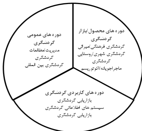
شکل ۲. الگوی سه بخشی آموزش گردشگری

۳. دوره‌های محصول/بازار-محور: این دوره‌ها بر ماهیت و ایجاد محصولات و بازارهای خاصی ۱ تمرکز دارند که نیازمند دانش و مهارت تخصصی برای ارائه‌ی مؤثر آن می‌باشند.