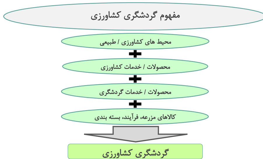
شکل ۱ مفهوم گردشگری کشاورزی