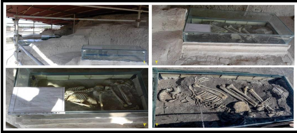
تصویر ۲. سایت موزه سیلک. ۱) نمای کلی از بقایای تدفین انسانی. ۲ و ۳) وضعیت برگه اطلاعات اثر و تابش نور خورشید بر روی داده انسانی. ۴) جداسازی برگه اطلاعات بدون پاک‌سازی محل چسب

موجود در ارتباط با مدیریت سایت موزه سیلک می‌توان به عدم پاک‌سازی سطح محوطه از گیاهان خودرو و بوته‌ها و قدیمی و ناخوانا بودن تابلوهای راهنمای نصب‌شده در ورودی محوطه (به‌ویژه تابلوی واقع در خیابان منتهی به تپه سیلک)، اشاره نمود.