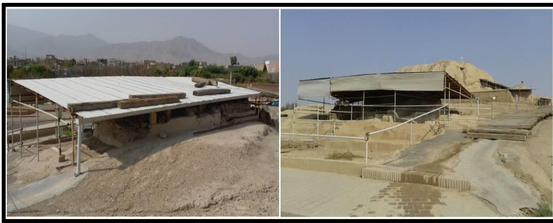
تصویر ۱. سایت موزه سیلک. سازه حفاظتی از جنس ایرانیت، مسیرهای دسترسی چوبی و سنگ‌فرش، آبراهه‌های سیمانی

باید توجه داشت که براساس استانداردهای بین‌المللی، هدف از ایجاد چنین مسیرهایی، سهولت دسترسی بازدیدکنندگان و ارائه بهتر آثار باستانی به آن‌هاست؛ در حالی‌که مسیرهای دسترسی بازدیدکنندگان به آثار باستانی نمایش‌داده‌شده در سایت موزه سیلک کاشان به گونه‌ای طراحی و تعبیه شده‌اند که از کارگاه‌های کاوش باستان‌شناختی باستان‌شناسان ایرانی و خارجی و همچنین آثار معماری موجود در سطح تپه فاصله چشمگیری