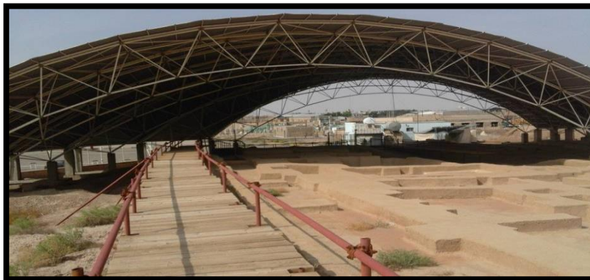
تصویر ۶. سایت موزه قلی‌درویش، مسیرهای چوبی برای حرکت بازدیدکنندگان

نکته مثبت سازه‌های فضایی به‌کاررفته در پوشش محوطه کاوش‌شده، استاندارد بودن آن‌ها از نظر استحکام در برابر باد و طوفان، جلوگیری از ورود نزولات جوی (برف و باران) به داخل محوطه و درنهایت عدم جلوگیری از تسلط دید بازدیدکنندگان