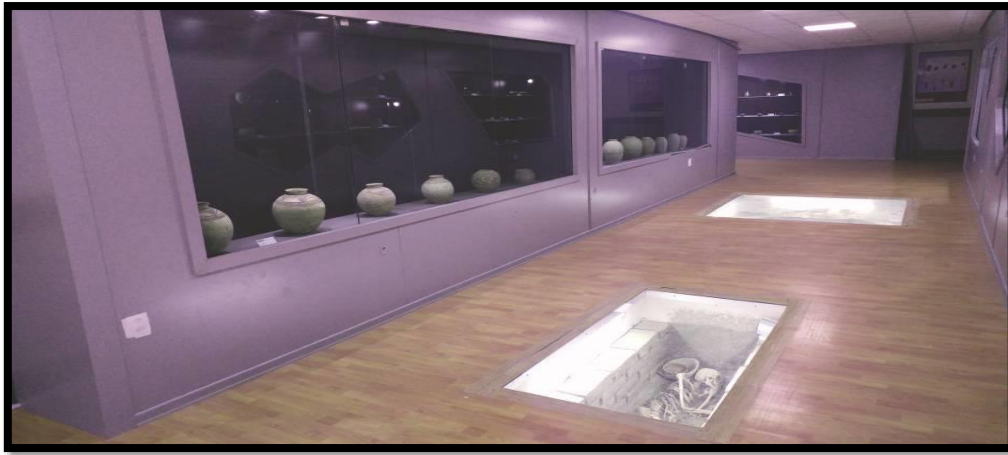
تصویر ۳. موزه شهر سوخته (واثق عباسی، ۱۳۹۸)

گذشته از اقدامات حفاظتی که پیش‌تر ذکر گردید، در راستای راهنمایی بیشتر بازدیدکنندگان در بازدید از محوطه شهر سوخته، در کنار بقایای معماری شناسایی‌شده از کاوش‌های باستان‌شناختی آن، تابلوهایی که در بردارنده اطلاعات تاریخی هر یک از این مکان‌ها هستند تعبیه شده است (تصویر ۴). تابلوهای مذکور گرچه از لحاظ اطلاعات ارائه‌شده، مفید و ارزشمند هستند، لیکن در برابر بادهای شدید منطقه از مقاومت چندانی برخوردار نیستند؛ لذا