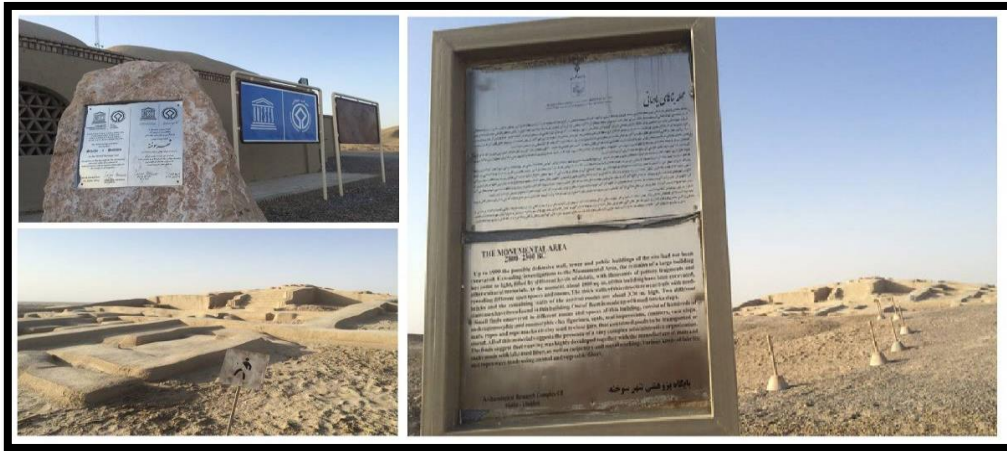
تصویر ۴. تابلوهای اطلاعات نصب‌شده در محوطه شهر سوخته (کریمی، ۱۳۹۴)