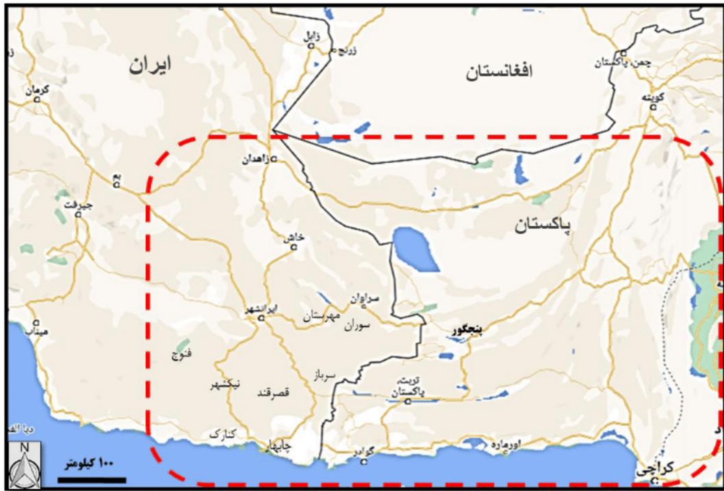
شکل شماره ۱. نقشه شماتیک محدوده مرزی ایران و پاکستان (استان سیستان و بلوچستان و محدوده جنوبی و جنوب غربی پاکستان)

دقت داده‌ها افزایش یافت. محدوده مطالعاتی پژوهش شامل ۱۴ شهرستان (دربگیرنده شهرستان‌های جدید) از استان سیستان و بلوچستان بود. داده‌های تحقیق، دربگیرنده طیف گوناگونی از متغیرهای کمی، کیفی و نیز دارای مقیاس‌های گوناگون اسمی، رتبه‌ای و فاصله‌ای،